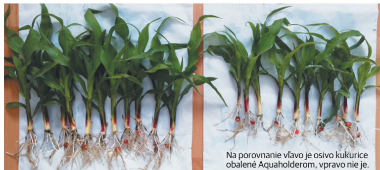
Na porovnanie vľavo je osivo kukurice obalené Aquaholderom, vpravo nie je.

žujúci vlahu. Môže byť použitý na akekoľvek pôde na zlepšenie a úpravu pôdnych vlastností. Je vhodný pre akékoľvek plodiny a rastliny.